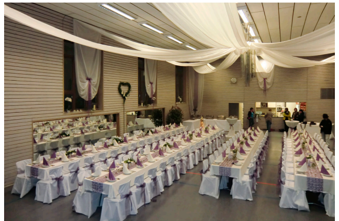
Die TV-Halle als Hochzeitslocation.