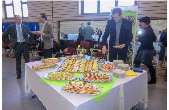
Sportkreisveranstaltung „Cool and Clean“ 2011.