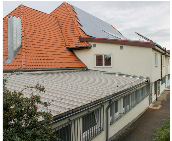
Halle mit neuem Dach und Photovoltaikanlage.

Eine weitere Bauaktion folgte noch im Jahr 2020 – und hoffentlich eine der letzten Großen: Die Renovierung der Geschäftsstelle! Ein Wasserschaden, verursacht durch ein undichtes Dach, machte es nötig, die Schränke komplett auszubauen und den Boden zu ersetzen. Mit neuen