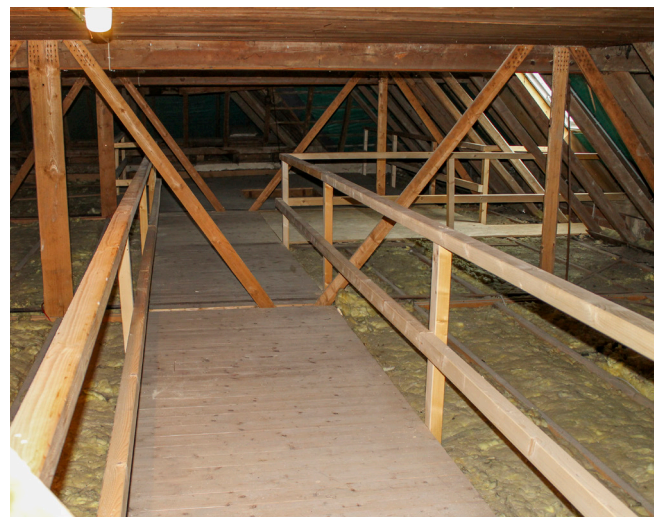
Baumaßnahmen zum geforderten Brandschutz 2013.