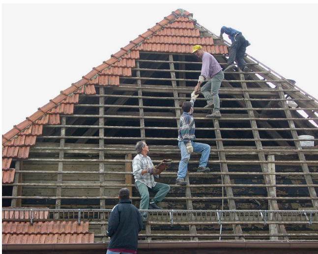
Dachsanieierung und Bau der Photovoltaikanlage 2008.

Im Jahr 2011 wurde den verantwortlichen Vorständen des Vereins bewusst gemacht, dass wieder eine Sanierung in der Halle ansteht: Nach einer Begehung mit Kreisbrandmeister und örtlicher Feuerwehr stellten diese einen Maßnahmenkatalog auf, der auf gesetzlichen Grundlagen basierte. Um entsprechende Brand-