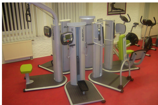
Neuer Gerätezirkel und Thekenbereich im „Impuls“.

Sportwelt: Aerobic wurde zum Trend, der Gesundheitssport gewann immer mehr an Bedeutung. Diesen verschiedenen Entwicklungen versuchte der Verein auch als Sportanbieter gerecht zu werden. 1987 begannen die Planungen für ein eigenes Fitnessstudio. Der Vorstand rechnete fest mit einem großzügigen Zuschuss und glaubte, das Projekt ohne große Eigenleistung stemmen zu können. Doch wie so oft kam es anders: Die zugesagten Fördermittel blieben aus. Was nun? Aufgeben war keine Option. Also hieß es einmal mehr: Ärmel hochkrempeln. Eine engagierte 15-köpfige Gruppe organisierte, plante und arbeitete mit vereinten Kräften und brachte das Projekt schließlich doch zum Erfolg. Die finanzielle Lage war dabei sogar so angespannt, dass man die benötigten Fitnessgeräte persönlich abholte, um die Transportkosten von Schorndorf nach Mögglingen zu sparen. Mit Albert Haag wurde ein Pächter gefunden, der das Studio bis zum Jahr 2008 erfolgreich betrieb. Um diese Zeit orientierten sich jedoch immer