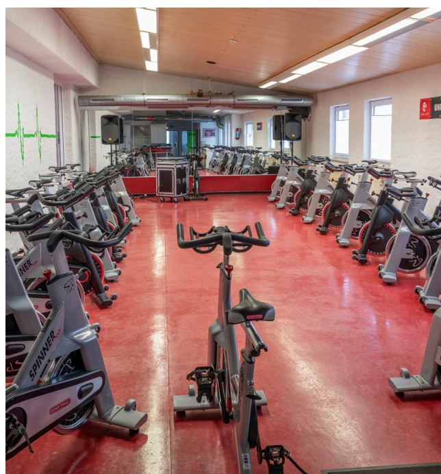
Das heute gut frequentierte Spinning- und Pilatesstudio.

Heute ist das „Säle“ täglich mit Pilates- und Yoga-kursen belegt und im ehemaligen Studio wird auf 20 Spinningrädern in vielen, größtenteils ausgebuchten Kursen, zu heißen Rhythmen geradelt.