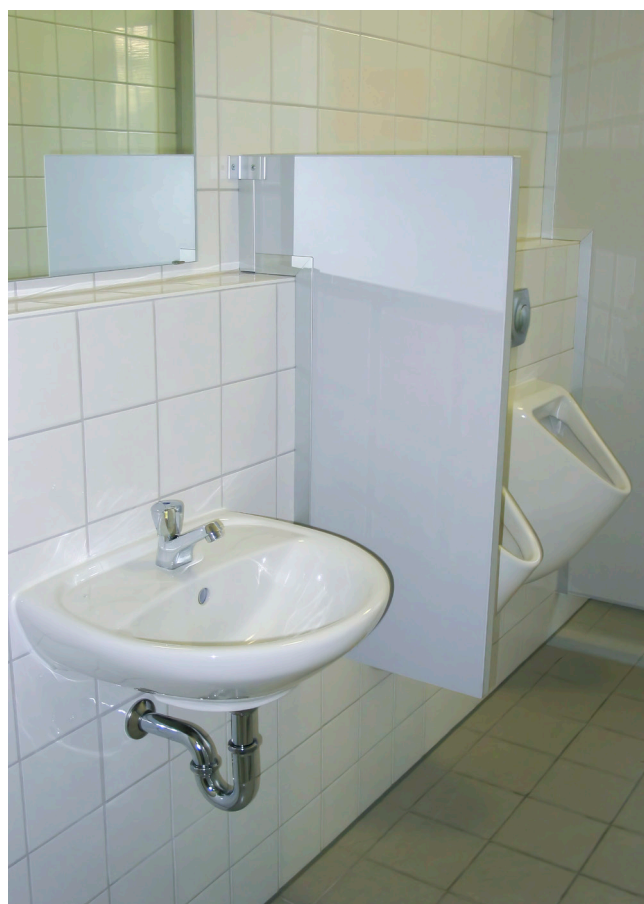
Neubau der Sanitär- und Umkleideräume 2004.

Dank der Unterstützung der Gemeinde Möglingen und einem neu erworbenen Grundstück entstand so in kurzer Zeit ein moderner Sanitärtrakt, der die traditionsreiche Halle fit für die Zukunft machte. Zum Jubiläumsjahr 2007 gab es schließlich noch einen passenden Außenanstrich.