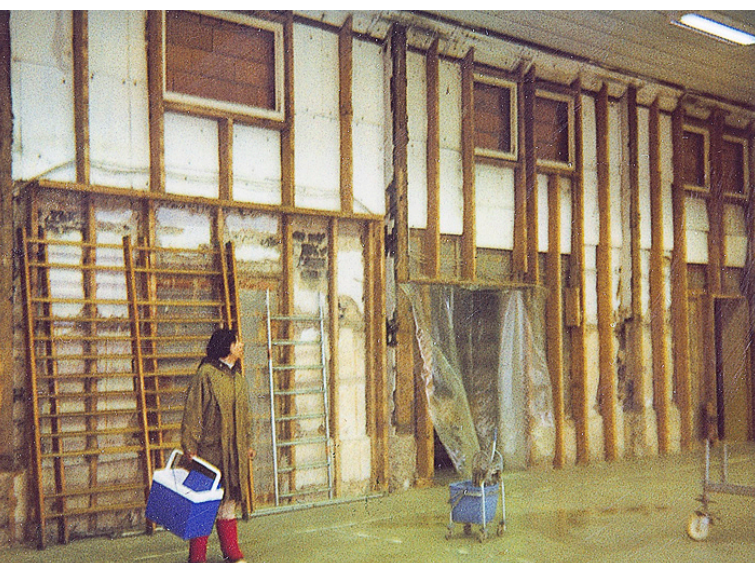
Renovierung der Halle im Jahr 1997.

Mit wachsendem Vereinsleben wurde schnell klar: Die kleine Halle reichte nicht aus. In einer außerordentlichen Generalversammlung am 10. Mai 1924 fasste man daher einen mutigen