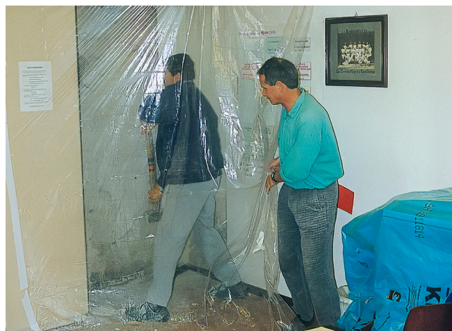
Durchbruch zur Geschäftstellenerweiterung 2001.

Mitte der 90er-Jahre dann stand eine umfassende Innensanierung an. Was folgte, war ein echtes Gemeinschaftsprojekt. Der Dachboden wurde entrümpelt, die Decke isoliert, eine neue Beleuchtung installiert, die alten Holzwände erneuert und als krönender Abschluss wurde ein neuer Hallenboden eingebaut. Besonders in Erinnerung bleibt dabei der Einsatz der „Alte Herren“-Mannschaft der Handballer: In tagelanger, schweißtreibender Arbeit entfernten sie den alten Boden, bauten ein neues Bodenfachwerk ein, und der Verein ließ durch einen Sportbodenspezialisten einen neuen Belag aufbringen. Das Ganze war eine echte Knochenarbeit, die sich jedoch gelohnt hat. Auch die Nebenräume wurden nach und nach modernisiert. Finan-